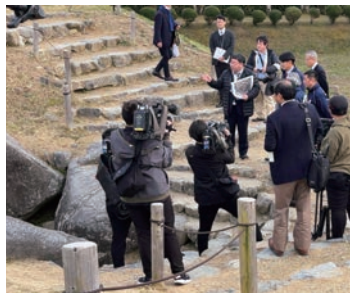
知事・首長への説明風景(石舞台古墳)

専門は保存科学、文化財科学。保存修復に関わった文化財は、国宝及び特別史跡・白柘磨崖仏、国宝・東大寺法華堂安置仏像群、国宝・銅造阿弥陀如来坐像(鎌倉大仏)など。2011年に発生した東日本大震災では、文化財レスキュー事業の中心的役割を果たした。2018年より文化庁古墳壁画室文化財調査官。高松塚古墳やキトラ古墳の保存活用、法隆寺金堂壁画の保存活用、火災にあった首里城跡地下遺構露出展示の保存にかかわる。2023年より現職。